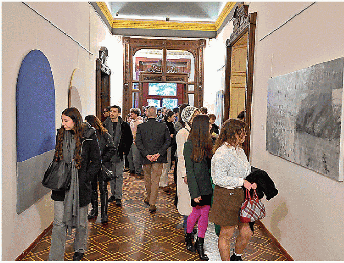
All'inaugurazione della mostra erano presenti allievi delle scuole superiori

Allievi dell'Accademia di Brera di Milano sono arrivati a Verbania dove è possibile vedere le loro opere a Villa Giulia nella mostra «Epilogo» che caratterizza la quarta edizione del progetto espositivo «Sguardi». Fino al termine di settimana prossima (domenica 22) è perciò possibile girare tra le stanze della dimora di Pallanza circondati dalle creazioni di 49 artisti che rappresentano alcune delle proposte più significative del dipartimento di arti visive dell'Accademia di belle arti milanese. Si va dalla pittura alla video arte, dalla fotografia all'installazione con un grande filo conduttore che è la creatività e l'energia espressiva.