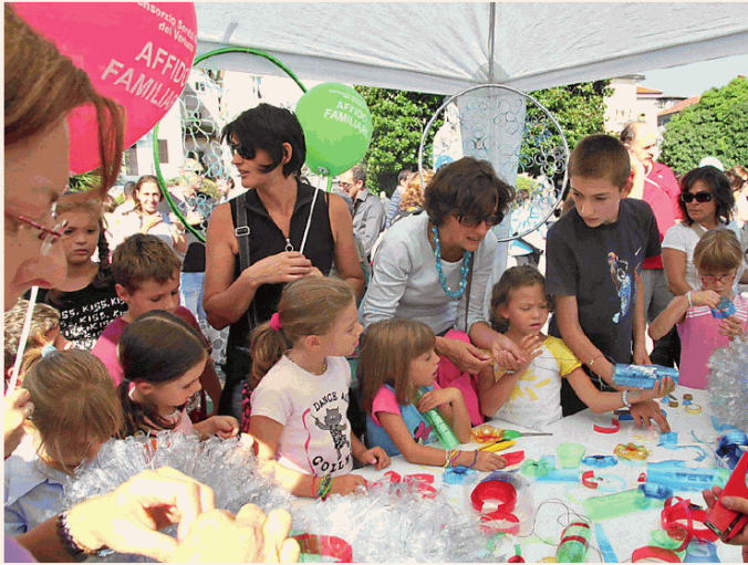
In precedenza la «città dei bambini» era a Pallanza; oggi è tra biblioteca e teatro Maggiore

Nel parco di Villa Maioni la ludoteca di Verbania gestisce uno spazio dedicato in particolare ai più piccoli della fascia 0-3 anni, l'Istituto comprensivo Antonini porta «Alla conquista di un seme», gli scout Pallanza mettono a prova l'equilibrio sul ponte tibetano, l'Istituto comprensivo di Intra con il Comitato genitori fa appello alla fantasia con «La fabbrica del riciclo» mentre il Monti Stella si occupa di intrattenere con giochi, il museo del Paesaggio aiuta i più piccoli a recepire i «Messaggi dalla natura» e il club ritmica Altair li invita a provare la ginnastica e i giochi di una volta; l'Oratorio don Bosco richiama «All'opera seguendo don Bosco» e la Casa del lago sensibilizza alla storia e alle tradizioni d'acqua dolce. Altre sono le attività previste nell'a-