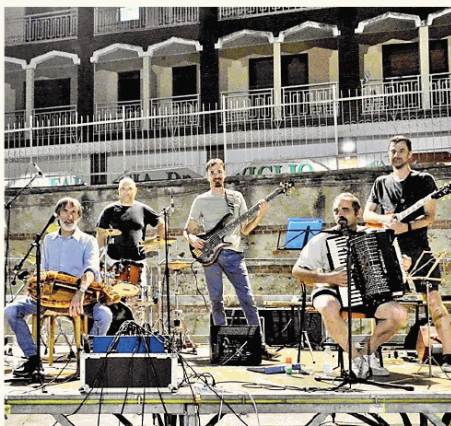
La Piccola orchestra dei popoli che si esibisce oggi a Verbania