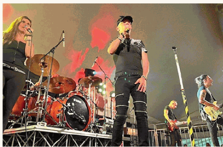
Stasera alle 21,30 le Deviazioni spappolate portano il tributo a Vasco