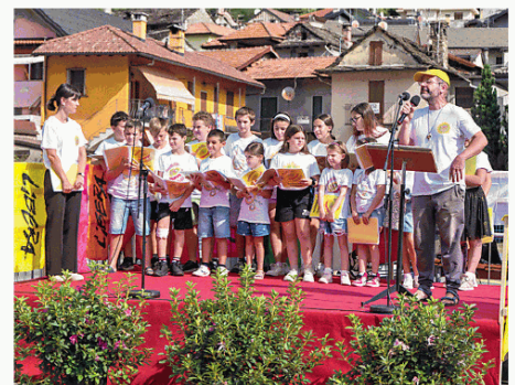
I bambini del coro «Libellula» di Crevoladosola

stato un momento storico. C'erano i gonfaloni istituzionali, le bandiere di Libera e dell'Anpi e il coro «Libellula» dei bimbi. Don Ciotti ha chiesto un impegno costante a difesa della Costituzione. «Non si deve spaccare il nostro punto di riferimento. È nata per unire e non dividere l'Italia. Troppo comodo dividere» ha sottolineato parlando dell'au-