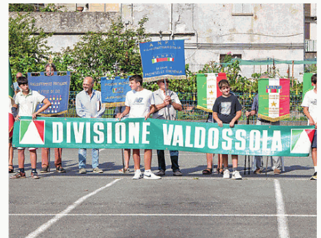
I gonfaloni dell'Anpi e dei comuni ieri mattina all'intitolazione

La mattinata di sabato per la comunità di Premosello è