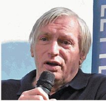
DON LUIGI CIOTTI FONDATORE DI LIBERA E GRUPPO ABELE

Intervento appassionato «di una persona piena di limiti che ha le Dolomiti nel cuore» che per quasi due ore ha parlato a circa 150 persone. Al centro la montagna, ma sempre facendo accenni alle battaglie per l'ambiente, alla lotta alle mafie e all'impegno